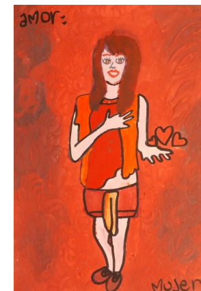
Obra de: María A. Garzón

En este seminario el semillero socializará avances de proyecto de investigación "Imaginarios de género en los enunciados estéticos de las y los docentes en formación de la LPI" el cual ganó la convocatoria No 15 de 2013, destinada a la "Financiación De Proyectos De Investigación Presentados Por Semilleros De Investigación Institucionalizados En La Universidad Distrital.