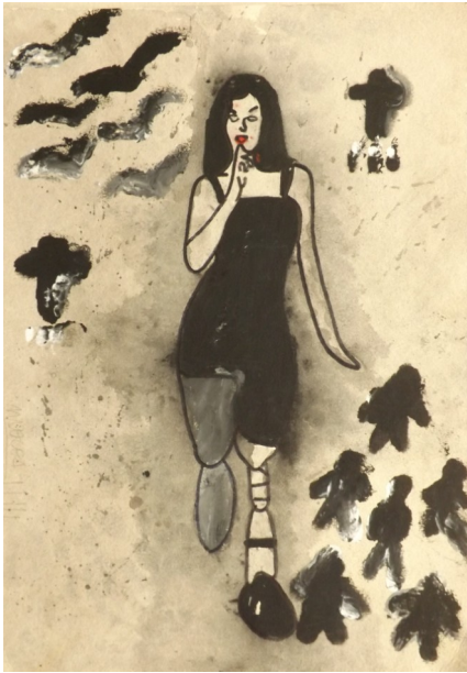
Obra de: Nicol Daniela Monroy

La Licenciatura en Pedagogía Infantil de la Universidad Distrital F.J.D.C. Presenta a la comunidad académica el “ SEMINARIO ESTUDIOS DE GÉNERO Y FORMACIÓN DOCENTE ” con el fin de aportar al debate actual sobre esta temática. En este encuentro se revisará que los estudios de género pueden ser asumidos como una categoría transversal que atraviesa todos los procesos formativos de las y los estudiantes tanto de la educación básica como de la educación superior.