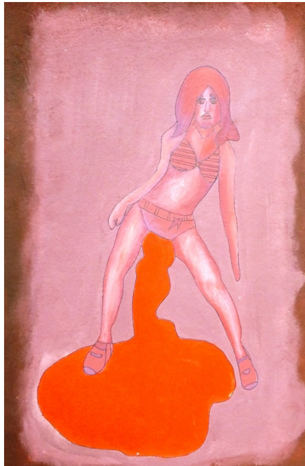
Obra de: Alaniz Vásquez O.

La Licenciatura en Pedagogía Infantil de la Universidad Distrital F.J.D.C. Presenta a la comunidad académica el “ SEMINARIO ESTUDIOS DE GÉNERO Y FORMACIÓN DOCENTE ” con el fin de aportar al debate actual sobre esta temática. En este encuentro se revisará que los estudios de género pueden ser asumidos como una categoría transversal que atraviesa todos los procesos formativos de las y los estudiantes tanto de la educación básica como de la educación superior.